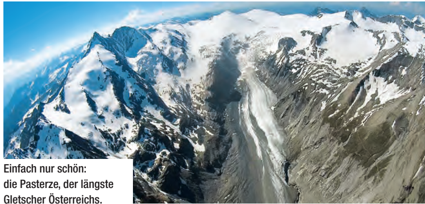
Einfach nur schön: die Pasterze, der längste Gletscher Österreichs.