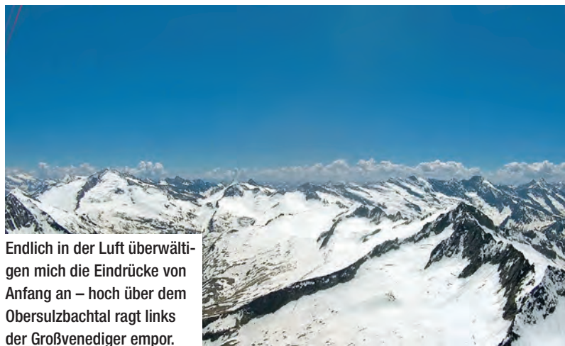
Endlich in der Luft überwältigen mich die Eindrücke von Anfang an – hoch über dem Obersulzbachtal ragt links der Großvenediger empor.

bis keine Thermik abwerfen, Südseiten gibt's keine. Vermutlich muss ich vor der Hauptkammquerung warten, bis die Westseiten des Krimmler Achantals aktiv werden.