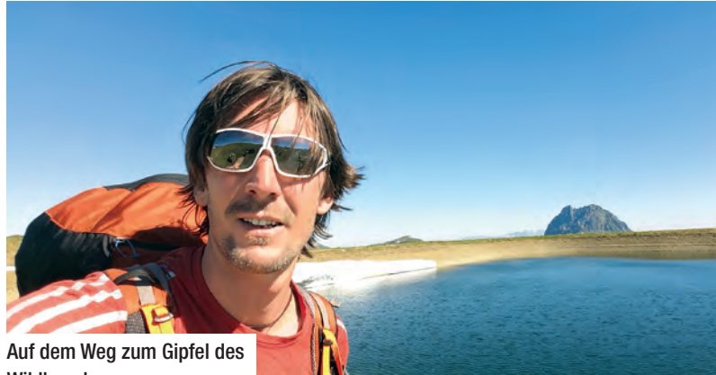
Auf dem Weg zum Gipfel des Wildkogel

Letztlich pressiert es eh nicht: Die schneebedadenen Ostseiten zum Talschluss des Obersulzbachtals werden wenig