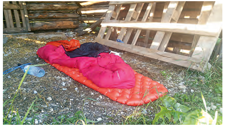
Mein Schlafplatzerl. Gipfelbiwak in Antholz sieht anders aus.

Ungläubig schaue ich in den wolkenlosen Pinzgauer Himmel. Es ist 19 Uhr und noch immer brütend heiß. Ich kann es kaum fassen, hier und jetzt am Boden zu stehen. Erschöpft und frustriert packe ich meine Ausrüstung und schleppe mich die wenigen Meter zum Hollersbacher Badesee. Die Abkühlung tut gut. Aber warum hier? Warum Pinzgau?