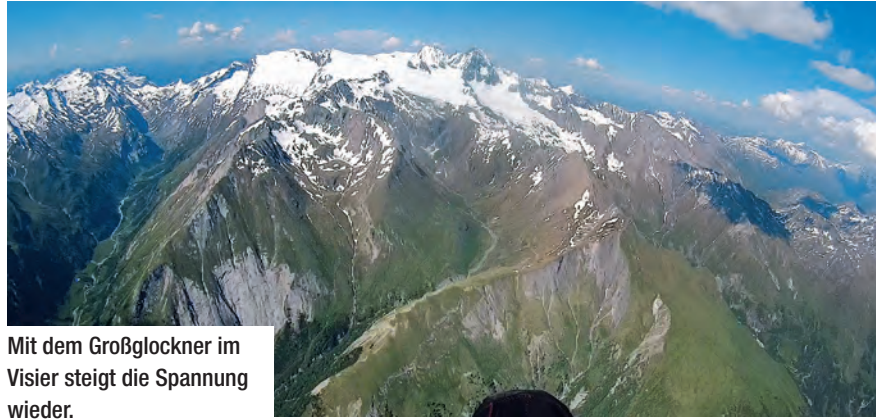
Mit dem Großglockner im Visier steigt die Spannung wieder.

Am Blaukogel bei Rauris erwartet mich die letzte Thermik dieses unglaublichen Tages. Während der Querung des