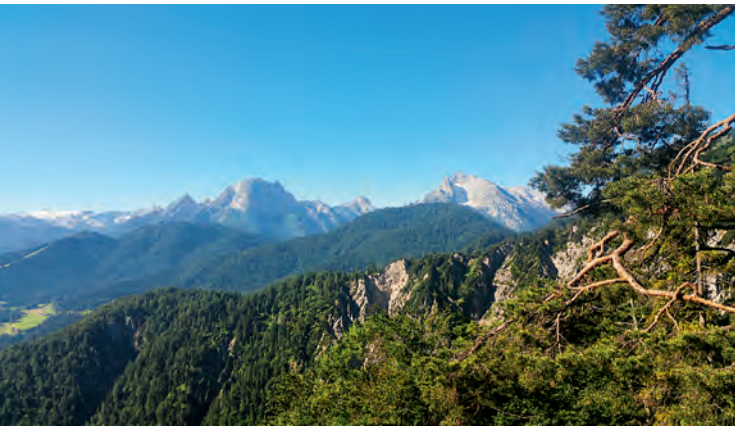
Aufstieg auf meinen Homestone: den Predigtstuhl. Im Hintergrund leuchten Watzmann, Hundstod und Hochkalter hervor.